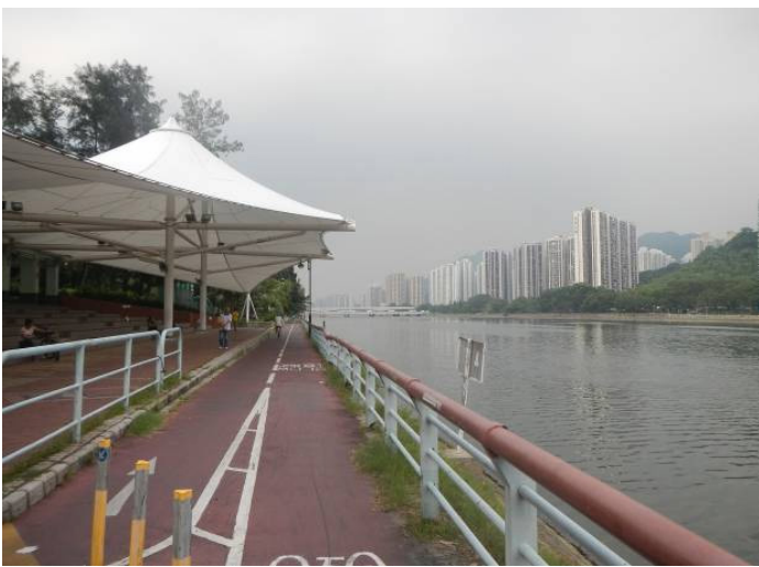
图 15：城门河畔的单车径

沙田新市镇设有安全便捷的行人路和单车径，方便行人和骑单车人士来往沙田市中心与住宅区及工业区，以及直达大部分休憩用地。马鞍山亦有类似的系统，尽量把住宅发展项目与休憩用地、社区设施和市中心连系起来。