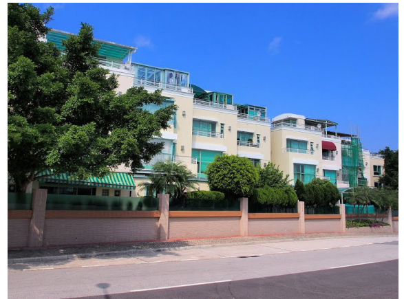
图 3：九肚的低密度住宅