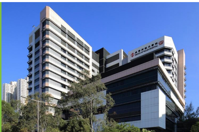
图6：威尔斯亲王医院

威尔斯亲王医院（图6）于1982年正式启用，是一家分区医院。位于亚公角的沙田医院和资助的慈氏护养院提供辅助医院服务。沙田亦有一间私家医院，扩建后可提供约600张病床。另外，沙田设有4间普通科诊疗所／健康中心，为区内居民服务。