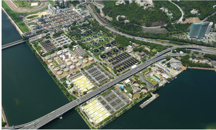
图 16：现时的沙田污水处理厂

现有的沙田污水处理厂位于沙田新市镇内，占地约 28 公顷。政府建议把该污水处理厂迁到亚公角女婆山的岩洞，以腾出原址的土地作其他有利的用途。岩洞亦可发挥屏障的效用，阻隔可能出现的滋扰（例如气味和噪音），使区内环境得以改善。当局现正就搬迁计划进行勘测及设计工作，研究引进相关先进技术的可能性，同时参考海外的经验，务使搬迁计划能发挥最大的成效（图 16）。