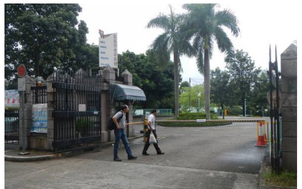
图 8：乌溪沙青年新村

规划上除提供上述主要休憩用地和康乐设施外，亦有打算在公共屋邨和大型私人住宅发展项目内提供足够的邻舍休憩用地和康乐设施。