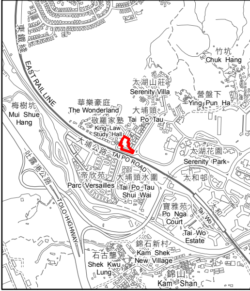
SCALE 1 : 20 000 比例尺